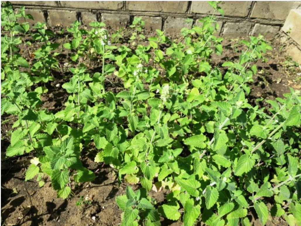
Рис. 6. Nepeta cataria L. культивируется около автостанции в ст. Кумылженской.