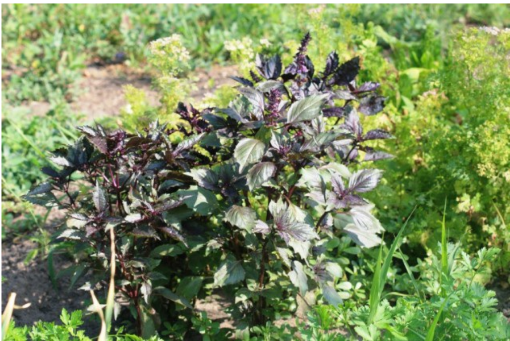
Рис. 7. Ocimum basilicum L. выращивается на огороде в ст. Букановская.