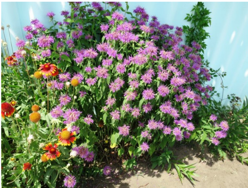
Рис. 5. Monarda fistulosa L. на цветнике около забора в ст. Кумылженской.

В культуре в европейской России наиболее распространены два вида: M. fistulosa , M. didyma L., и, реже, M. citriodora Cerv. ex Lag. На территории ППНХ нами достоверно обнаружен только один вид – M. fistulosa , который изредка культивируется в некоторых станицах (ст. Кумылженская, Букановская, Алексеевская). По всей вероятности, на Нижнем Хопре могут встретиться и другие приведенные выше виды (в первую очередь M. didyma ). Указанные виды довольно часто плохо различают, в связи с этим мы приводим здесь ключ для их определения, составленный по нескольким источникам (Cleason, Cronquist, 1963; Steyermark, 1981; Горлачёва, 2009).